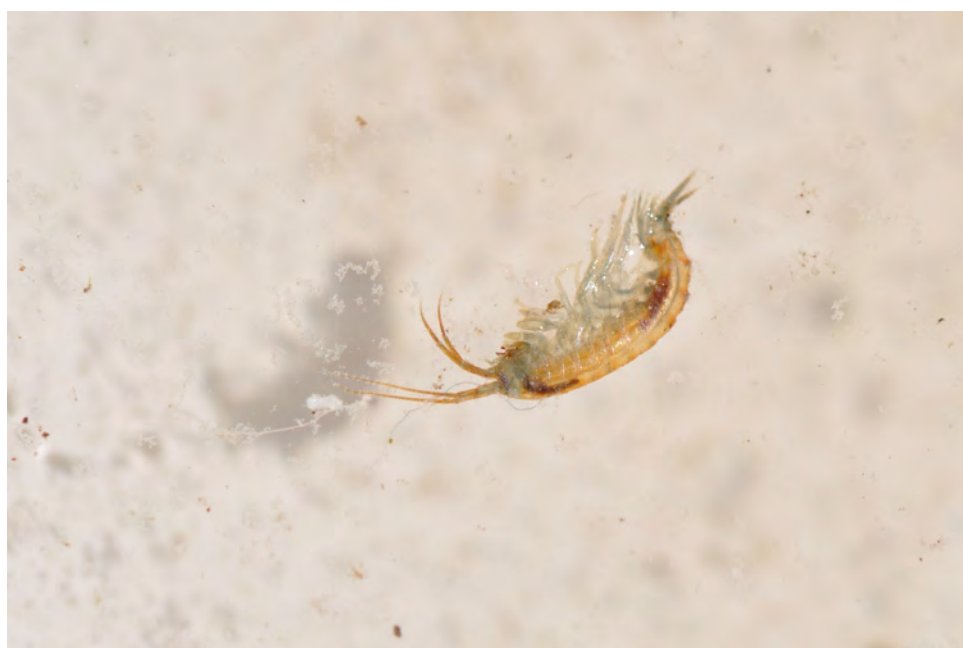
◆ Jana Winderen, 2014.

Dans la continuité de ce qui a été fait lors de la première visite de la vallée de l'Orne en juin 2014, il faudra interroger et échanger avec les riverains et les scientifiques sur ces rivières et fleuve, en enregistrant et interviewant les gens. Ces enregistrements seraient alors combinés avec ceux des insectes subaquatiques. Les enregistrements faits sous l'eau renseignent sur la santé de l'eau en identifiant les espèces d'insectes subaquatiques (qui font des bruits importants). L'enregistrement de la vitesse de l'eau, c'est-à-dire le son émis par le mouvement de l'eau, le déplacement du sable, les cailloux présents ou non sur le lit de la rivière, sont aussi des éléments pour comprendre la rivière ou le fleuve.