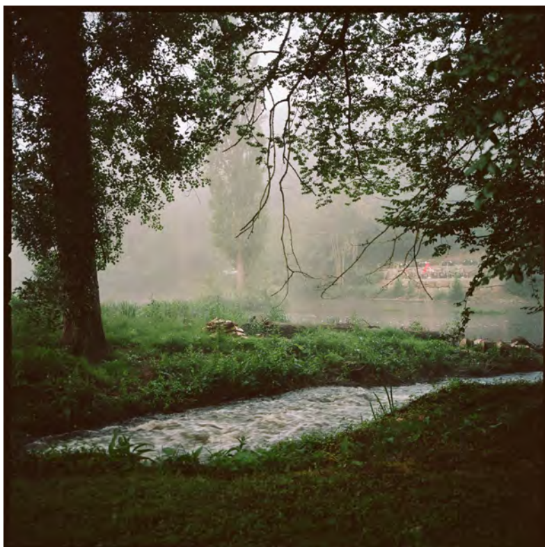
◆ Agnès Villette, 2014. DR.

La valorisation passe par une diffusion de cette recherche à la fois à l'ésam Caen/Cherbourg et sur les différents sites pour conserver ce lien avec le genius loci. Plusieurs événements pour valoriser la recherche sont proposés :